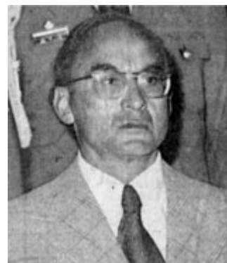
Luis Echeverría Álvarez.

Cuando fue fundada la escuela, el presidente Luis Echeverría Álvarez mantenía la política de construir edificios escolares y equipar adecuadamente a las escuelas de Veterinaria que contarán con un terreno de 300 hectáreas o más. Como al adquirir el predio de El Salado la UAP cumplía ya con este requisito, las autoridades universitarias gestionaron apoyos para la escuela tanto ante el CAPFCE como ante la presidencia de la República y el Fideicomiso para el Fomento de la Educación Agropecuaria y Forestal (FFEAF) logrando en 1976 la donación de una flotilla de tractores TW20 y Massey Ferguson, una cultivadora de 20 discos, equipo audiovisual, maquinaria agrícola, un moderno equipo de ordeñadoras automáticas, implementos para el procesamiento de forrajes, un vehículo para uso de la escuela y un presupuesto de 86