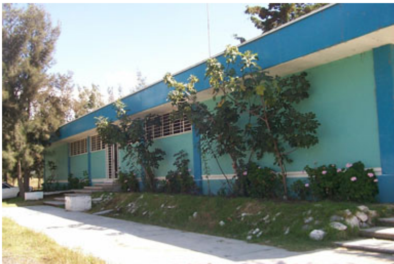
Acceso a los laboratorios multidisciplinarios en la posta de El Salado.