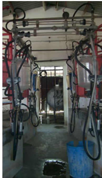
Ordeñadoras automáticas, en la posta de El Salado.

Después de un choque violento que se efectuó en las afueras del edificio Carolino el 1º de agosto, los estudiantes y profesores que se negaron a retornar a Tecamachalco fueron expulsados de la UAP.