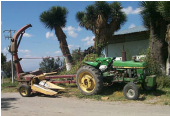
Tractor John Deere adquirido con fondos propios de la posta en 1993.