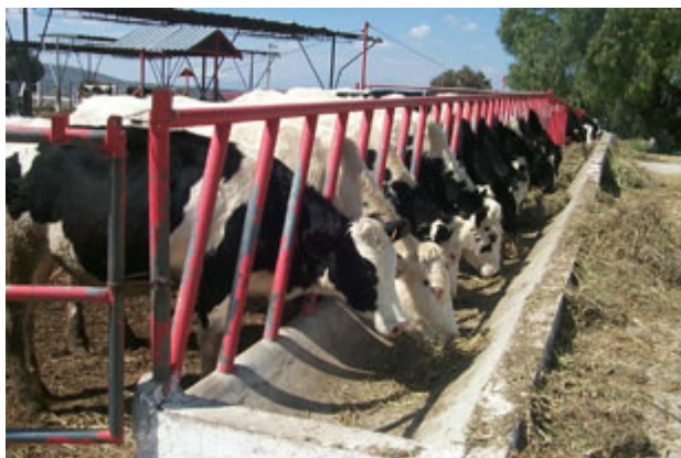
Ganado vacuno, en la posta de El Salado.