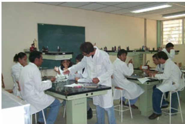
Actividades académicas en laboratorios.

procreador de otros animales de su misma estirpe.