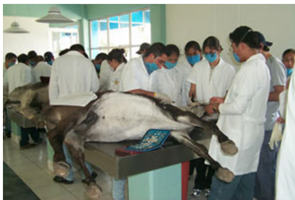
Disección de burros, en el laboratorio de la posta de El Salado.

Si bien el predio pertenecía a los ejidatarios de Tecamachalco, había sido invadido desde diez años antes por campesinos de Tuzupán, que lo usufructuaban en ese momento. En esta situación se