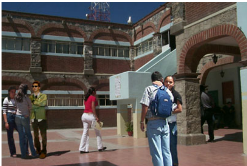
Interior del edificio ocupado por aulas y la dirección de la escuela.

Durante la existencia de esta unidad académica, ha sido relevante su papel impulsor tanto del desarrollo económico como de la salud pública de la región de Tecamachalco. Actualmente cuenta con un prestigio nacional bien cimentado y se encamina por rutas de superación del proyecto que le dio origen.