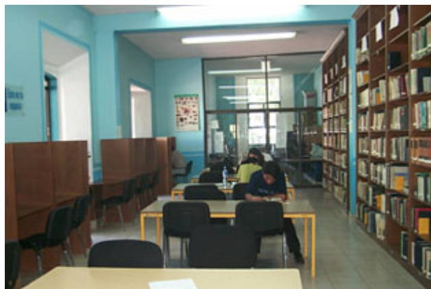
Biblioteca Jorge Espinoza Moro.

Otro aspecto es el referente al control de la natalidad felina y canina ya que lo extenso de su población predispone a la proliferación de brucelosis, toxoplasmosis y rabia. Para ello es necesario un programa de control de población en perros y gatos.