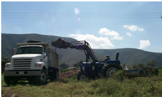
Tractor recientemente adquirido por la escuela.

La primera revisión autocrítica del quehacer académico de la escuela ocurrió durante el 1er. Congreso Interno de la EMVZ, iniciado el 24 de noviembre de 1977. De este evento emanaron importantes acuerdos para la transformación curricular de la carrera y la revisión de sus métodos de estudio así como el diagnóstico de sus necesidades a corto, mediano y largo plazo.